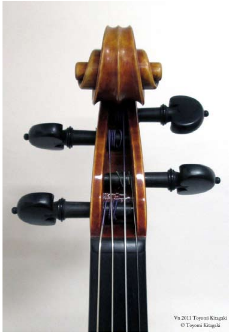
Vn 2011 Toyomi Kitagaki