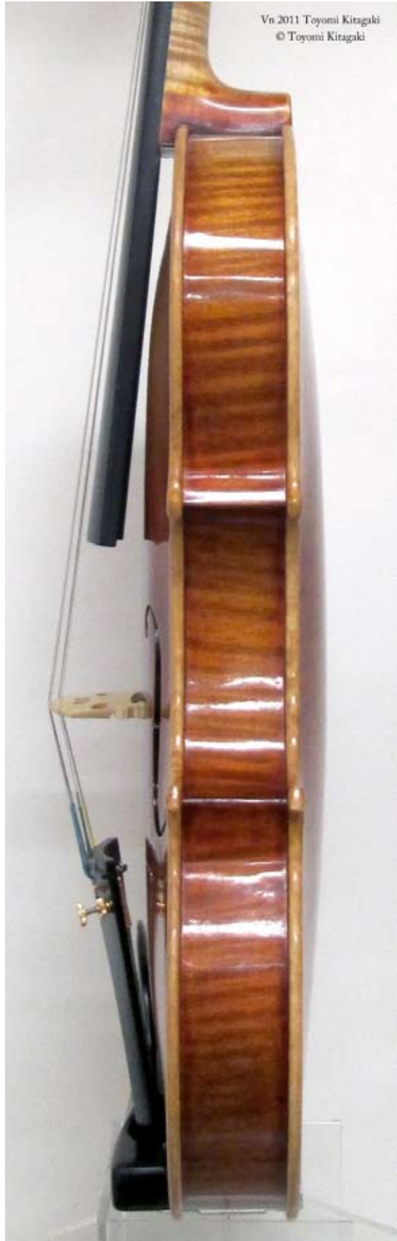
Violin 2011 Toyomi Kitagaki