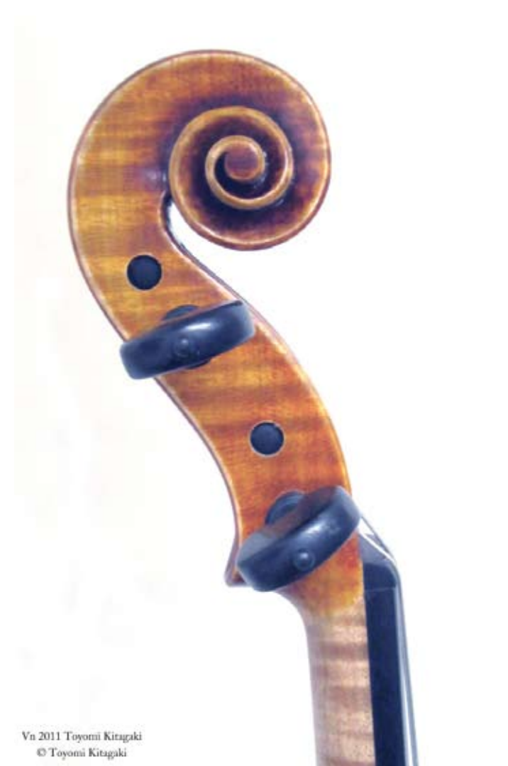
Vn 2011 Toyomi Kitagaki