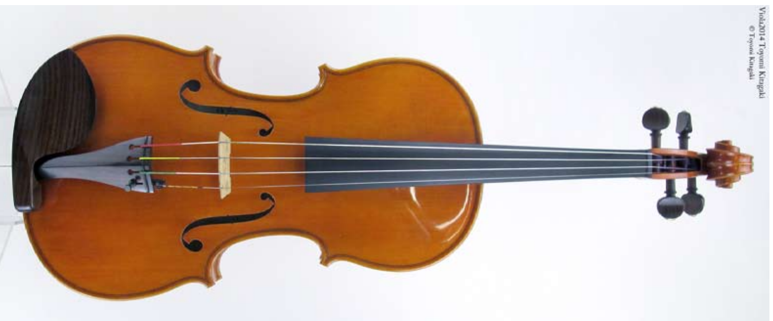
Viola 2014 Toyomi Kitagaki (Lunghezza. 410mm) (Sold.)

Viola 2014 Toyomi Kitagaki