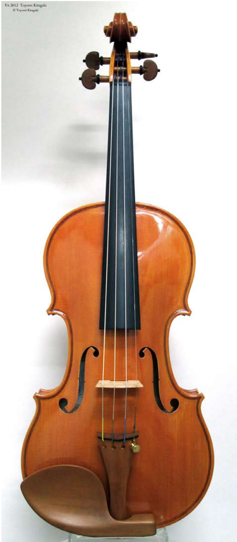
Violin 2012 Toyomi Kitagaki

Vn 2012 Toyomi Kitagaki © Toyomi Kitagaki