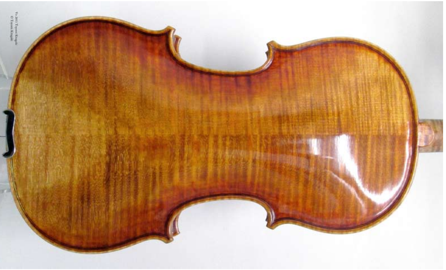
Violin 2011 Toyomi Kitagaki

Va. 2011 Toyomi Kitagaki