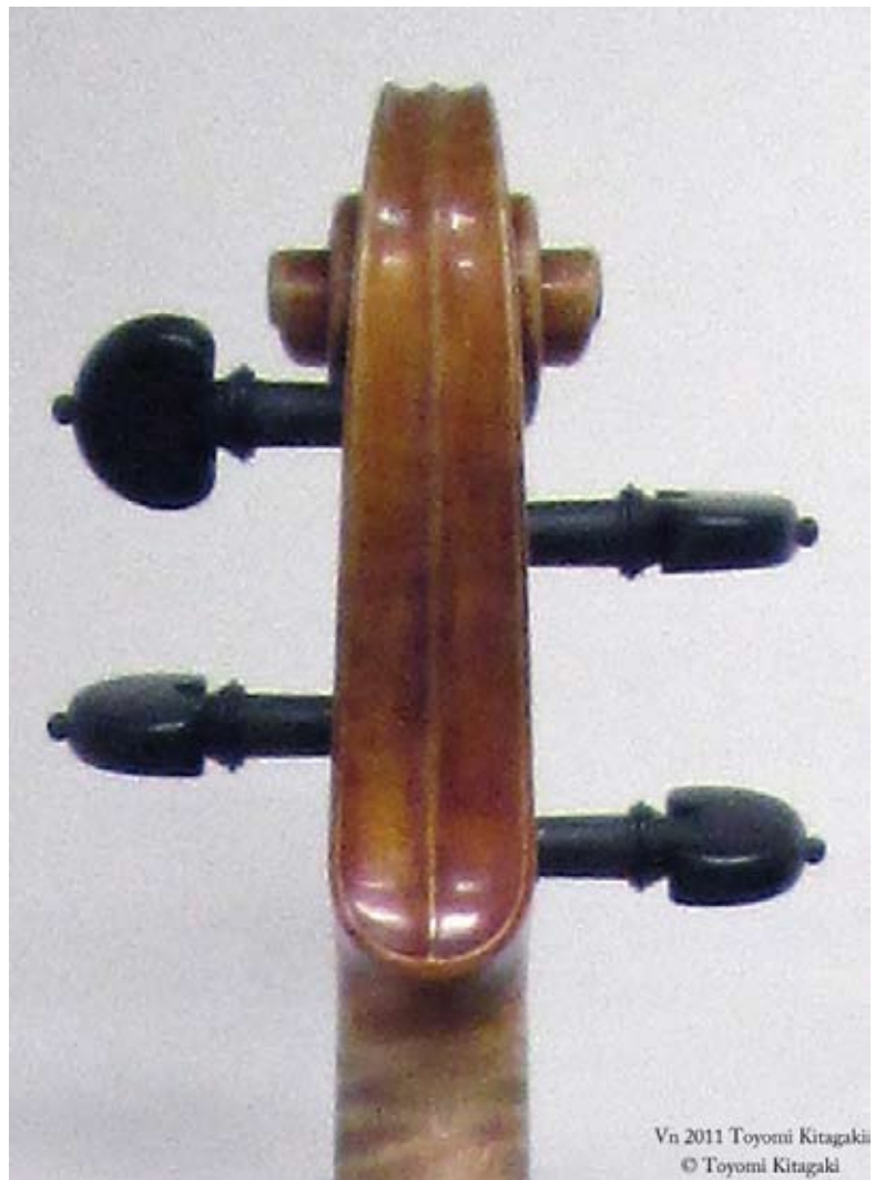
Vn 2011 Toyomi Kitagaki